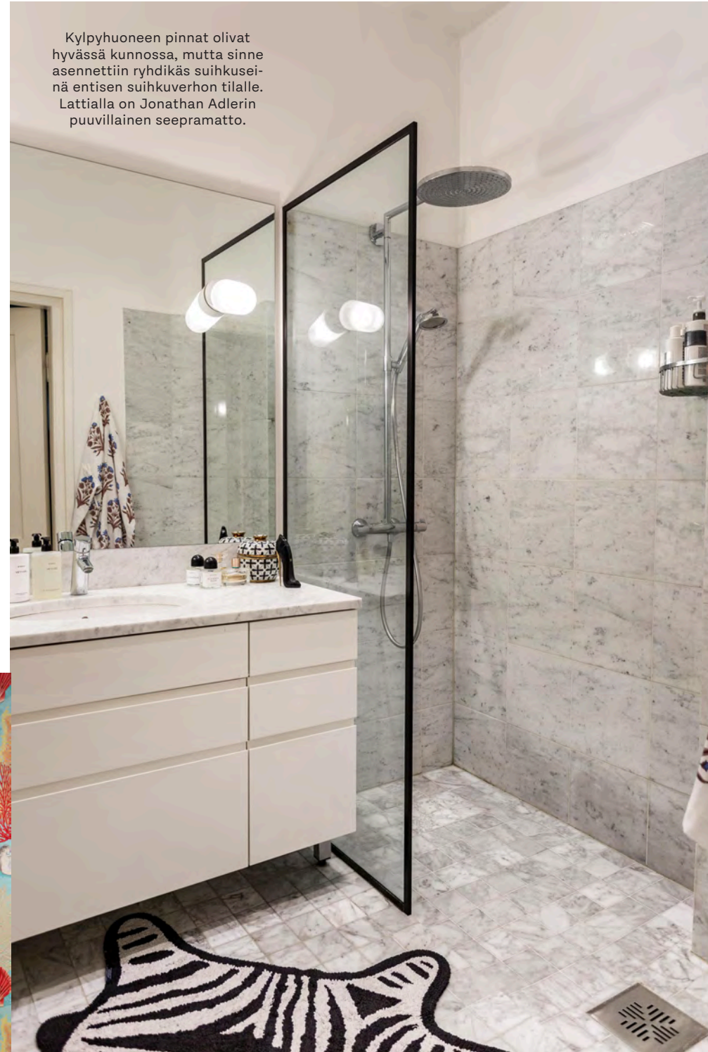
Kylpyhuoneen pinnat olivat hyvässä kunnossa, mutta sinne asennettiin ryhdikäs suihkuseinä entisen suihkuverhon tilalle. Lattialla on Jonathan Adlerin puuvillainen seepramatto.